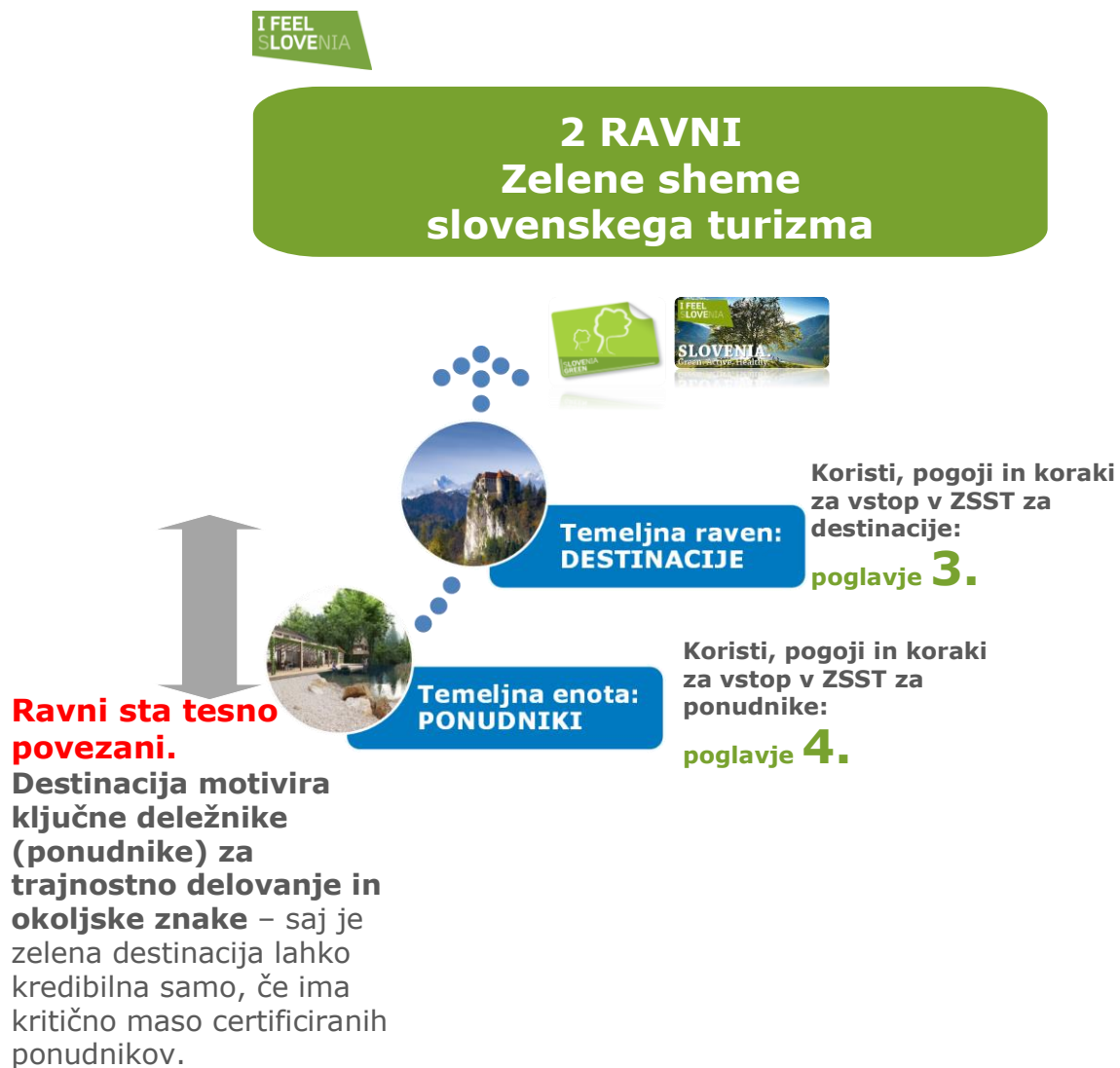
Shema št. 1: Prikaz dveh ravni delovanja ZSST