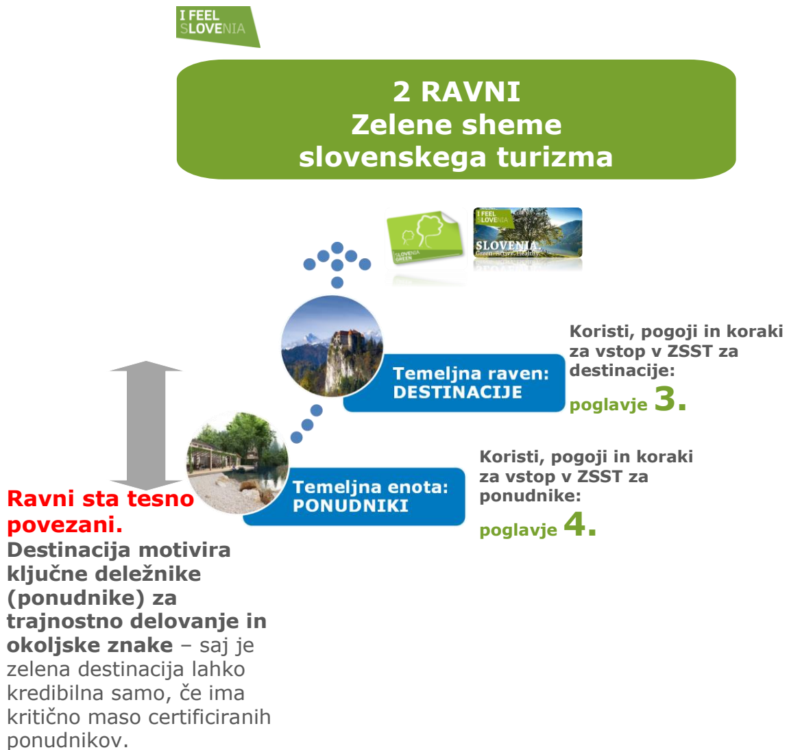
Shema št. 1: Prikaz dveh ravni delovanja ZSST