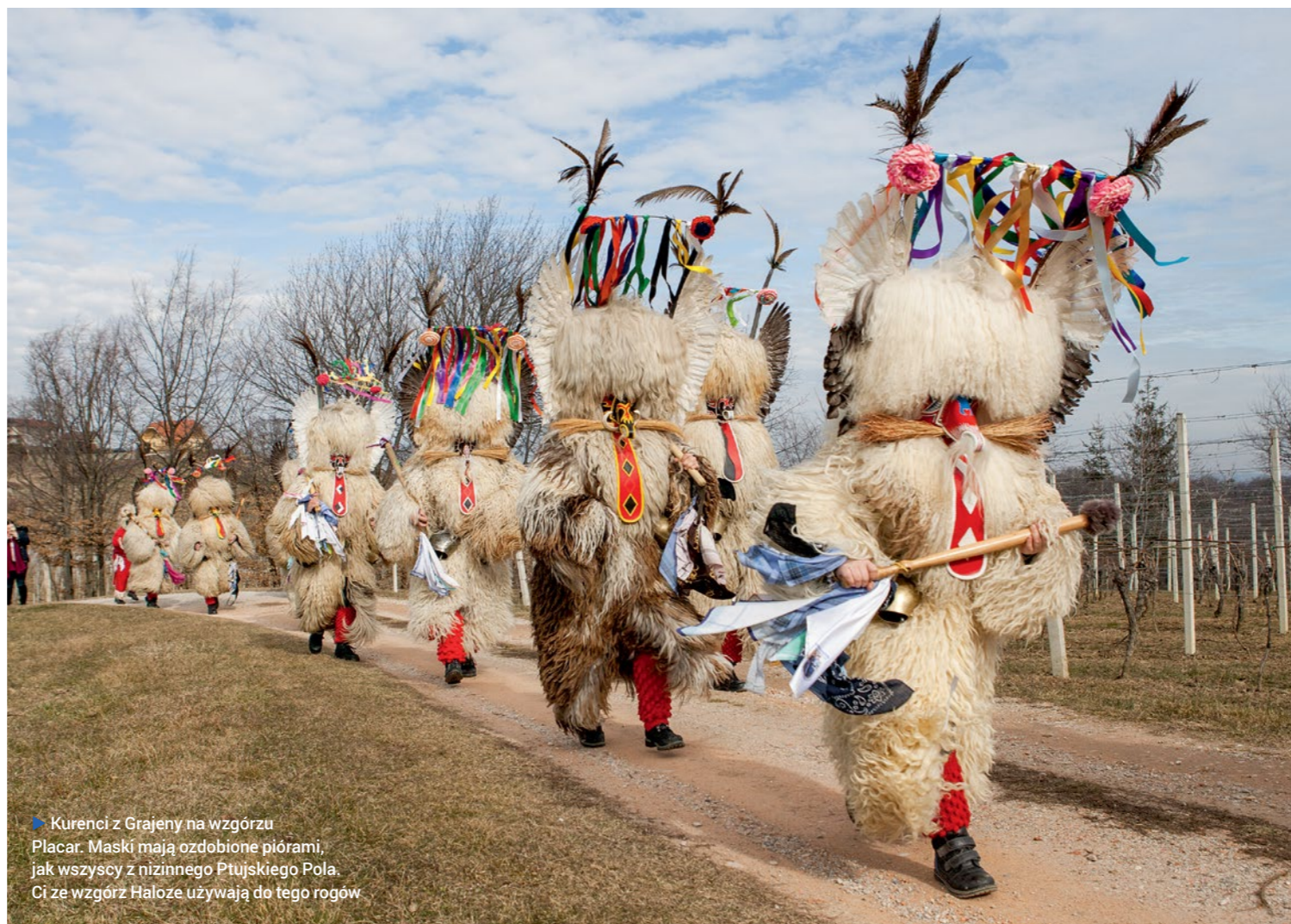
▶ Kurenci z Grajeny na wzgórzu Placar. Maski mają ozdobione piórami, jak wszyscy z nizinnego Ptujskiego Pola. Ci ze wzgórz Haloze używają do tego rogów

Maski idą. Na Prešernovej tłum, że igły nie wciśniesz. Gapie tłoczą się pod kamienicznkami, środkiem idą stwory. Konie mają czapy z kwiatami z bibuły, oraczom wiatr płacze wstążki u kapeluszy. Cyganie z Dornawy jadą wozem. – Powróżyć? – pytają znad kart, ćmią fajki. Wokół tych, co idą z batami, jakby luźniej: ludzie boją się zbliżyć, bo wiadomo, czy który nagle nie strzeli? Drepczą dziady z Soštanja obsypane igliwiami i eleganci z Morinje w cylindrach i frakach. Ci z Dobrovej wywijają długimi nosami i jeszcze dłuższymi drągami, butalci z Cerkvicy zagląдают widzom w oczy twarzami marionetek. Maszeruje grupa z Ilirskiej Bistricy. Kogo tu nie ma: policjant, staruszka, małpa z czerwonym tyłkiem, Turek w turbanie prowadzi na łańcuchu słońca. Są i oni. Futra mają gęste, jęzory wywalone na wierzch, z masek sterczą pióra, rogi, wąsiska. Szczerzą zęby, trzęsą dzwon-