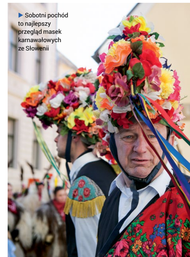
▶ Sobotni pochód to najlepszy przegląd masek karnawałowych ze Słowenii

Kurenci wesołym dzwonieniem niosą życzenia hen w niebo