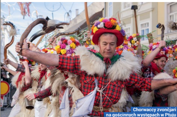
Chorwacy zvončari na gościnnych występach w Ptuj

Okres karnawału otwiera Skok Kurentów w nocy z 2 na 3 lutego w Budinie na obrzeżach Ptuj. Od tego dnia w okolicznych wsiach można spotkać grupy przebierańców odwiedzające domy. Nie ma oficjalnego harmonogramu. Trzeba zdać się na łut szczęścia lub podpytać w informacji turystycznej. www.ptuj.info Cykl pochodów w mieście rozpocznie sobotnia Etnoparada (15.02) . Pójdą w niej kurenci i inne tradycyjne maski z całej Slovenii. Od niedzieli do piątku (16.-21.02) przed ratuszem będą się odbywać pokazy postaci z karnawałowego korowodu. W kolejny weekend ulicami przejdzie sobotnia Parada Mieszczńska , nawiązująca do XIX-wiecznych balów, potem Parada Międzynarodowa w niedzielę z przebierańcami z całego świata i wreszcie Parada Dziecięca w poniedziałek. Zabawę zakończy Pogrzeb Karnawału w ostatki. www.kurentovanje.net