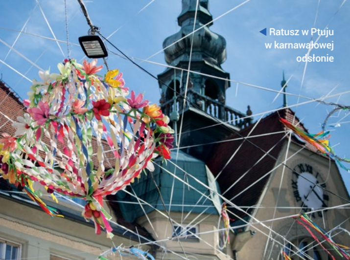
▶ Ratusz w Ptuj w karnawałowej odstanie