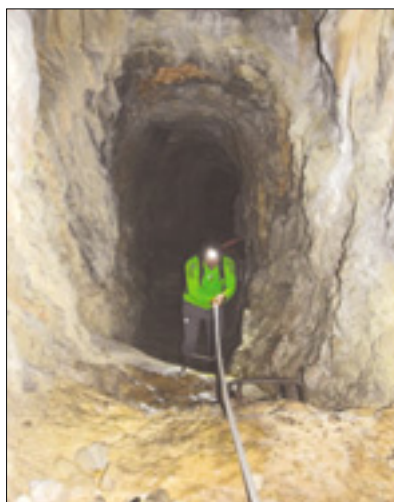
Pot ob jeklenici skozi Skalnico