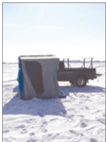
Allanova hiška za ribolov na zamrznjenem michiganskem jezeru