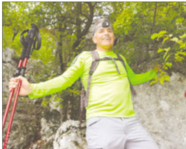
Dobra volja je najboljša!