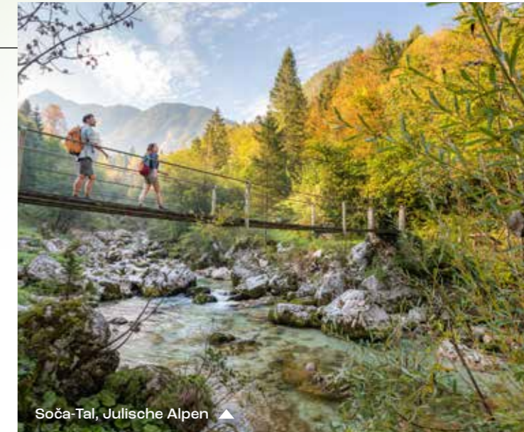
Soča-Tal, Julische Alpen ▲

Neben den natürlichen und kulturellen Besonderheiten der Alpen, die in einem der ältesten Nationalparks Europas geschützt sind, bietet die touristische Makroregion „Alpenländisches Slowenien“ eine unglaubliche Vielzahl an Möglichkeiten für Aktivitäten unter freiem Himmel. Hier bleiben Sie immer in Kontakt mit der Natur!