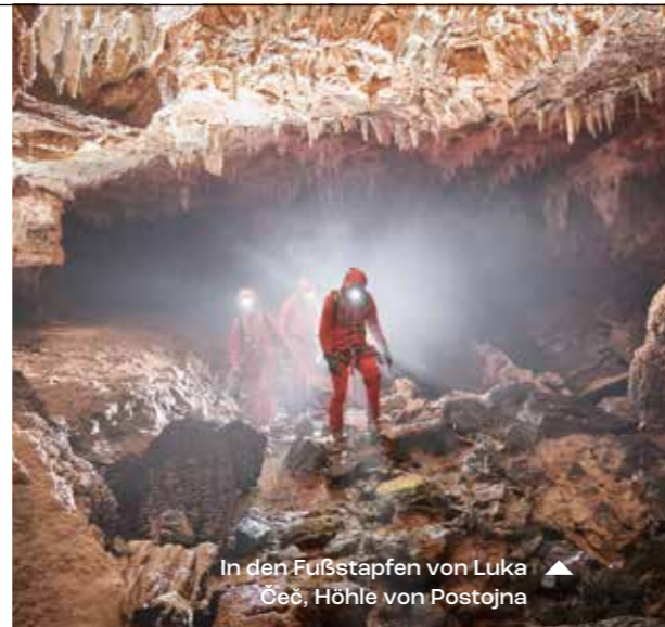
In den Fußstapfen von Luka Čeč, Höhle von Postojna ▲

Im Bereich Tourismus entwickelt Slowenien schon seit Jahren systematisch individuelle Boutique-Erlebnisse im Einklang mit seinen strategischen Zielen. Die wichtigsten touristischen Produkte Sloweniens basieren auf der Wahrung der Privatsphäre der Gäste und der Berücksichtigung ihrer Wünsche. Ein weiterer Faktor, der es Ihnen erlaubt, Slowenien auf Ihre Art zu erleben!