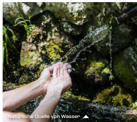
Natürliche Quelle von Wasser ▲

Slowenien: atemberaubendes Naturspektakel.