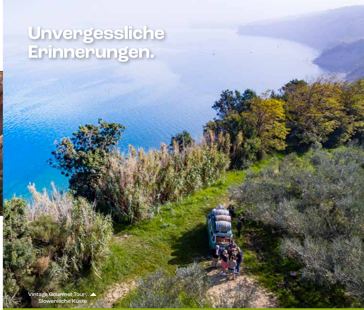
Vintage Gourmet Tour, ▲ Slowenische Küste

Die Sloweninnen und Slowenen, die für ihre Gastfreundschaft und ihre Fremdsprachenkenntnisse bekannt sind, legen ihren Gästen nahe, denselben Lebensstil zu genießen wie sie selbst – im Einklang mit der Natur, mit Respekt gegenüber allem Lokalen und im Zeichen der Nachhaltigkeit.