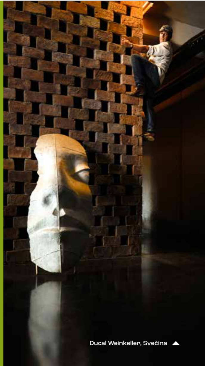
Ducal Weinkeller, Svečina ▲

Die slowenischen Thermen, Naturheilbäder und Wellnesszentren liegen an altherwürdigen, geschichtsträchtigen Thermalquellen. Natürliche Heilelemente wie Wasser, Torf, Klima, Thalassotherapie, Sole und Heilsalzschlamm, die sich seit jeher bewährt haben, gehen hier mit modernem medizinischem Know-how und einem reichen Wellnessangebot einher.