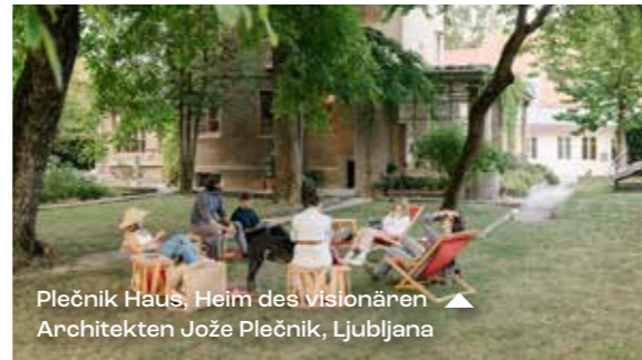
Plečnik Haus, Heim des visionären Architekten Jože Plečnik, Ljubljana ▲

Wenn Sie in Slowenien von einer Stadt zur anderen reisen, präsentiert sich Ihnen die Natur auf Schritt und Tritt in all ihrer Schönheit. Jeder Stopp bietet eine bezaubernde Mischung aus lokalem Charme und historischen Besonderheiten. Sloweniens Städte zeichnen sich durch ihre Einzigartigkeit aus, doch haben sie eines gemeinsam: Sie sind von überschaubarer Größe und somit leicht zu erkunden.