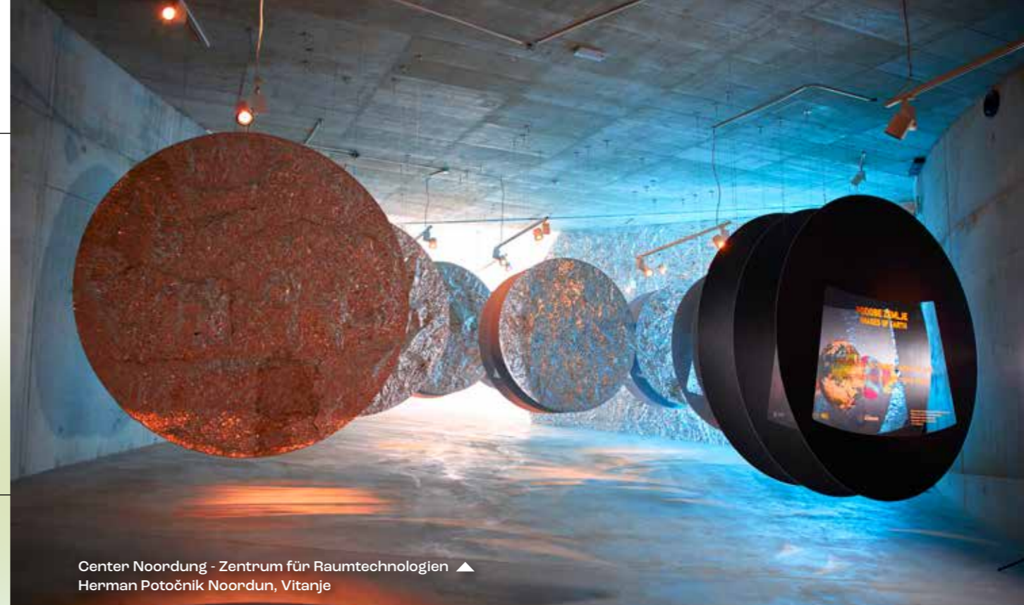
Center Noordung - Zentrum für Raumtechnologien ▲ Herman Potočnik Noordun, Vitanje

Der authentische Klang der slowenischen Volksmusik hat in den Melodien von Slavko Avsenik und seinen Original Oberkrainern seine charakteristischen Noten gefunden, die in geschickter Weise Elemente des Jazz in ihre Lieder einfließen ließen und somit eine einzigartige Fusion geschaffen haben. Ihr „Trompetenecho“ wurde mehr als 600-fach gecovered und gilt als das weltweit meistgespielte Instrumentalstück des 20. Jahrhunderts. Bemerkenswert ist, dass das Ensemble diese zeitlose Komposition schon 1955 und somit fünf Jahre vor dem ersten Jazzfestival von Ljubljana uraufführte.