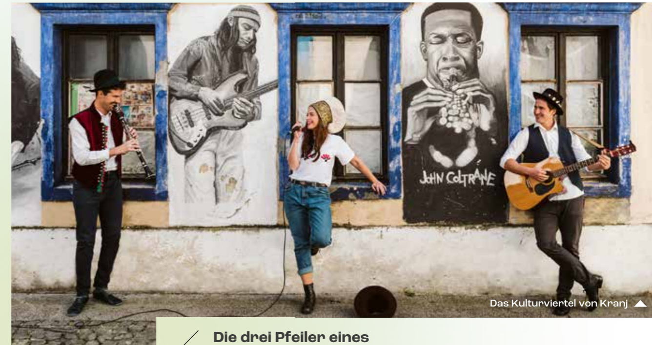
Das Kulturviertel von Kranj ▲

Fast jede weltberühmte Sehenswürdigkeit ist mit touristischen Erlebnissen, Veranstaltungen und Museumsausstellungen verknüpft.