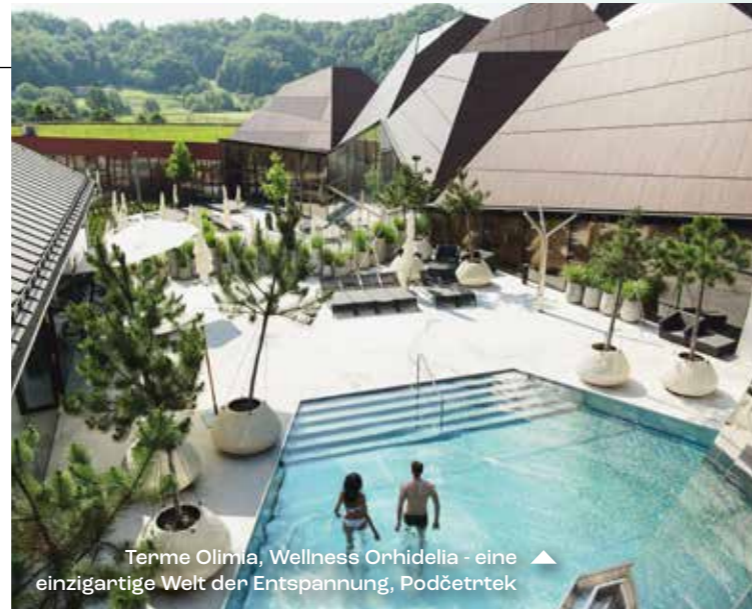
Terme Olimia, Wellness Orhidelia - eine einzigartige Welt der Entspannung, Podčetrtek ▲

Am Rande der Tiefebene, die Mitteleuropa seinen unverwechselbaren Charakter verleiht, finden Sie eine Reihe slowenischer Thermen und Heilbäder. Sie sind zwischen sanften Hügeln eingebettet, auf denen seit Jahrtausenden Wein angebaut wird. Die touristische Makroregion „Thermales Pannonisches Slowenien“ ist für seine authentische und herzliche Küche bekannt.