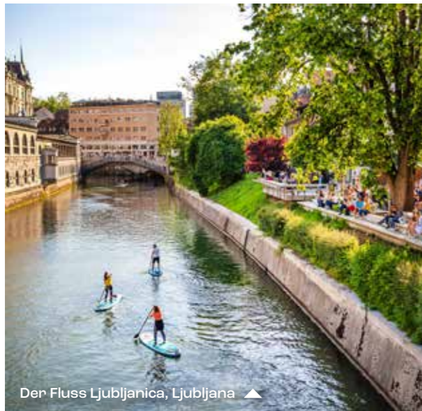
Der Fluss Ljubljanica, Ljubljana ▲

Ljubljana, die blühende Hauptstadt und die größte Stadt Sloweniens, die weniger als dreihunderttausend Einwohnerinnen und Einwohner hat, kann sich des ehrenvollen Titels „Best Destinations for a City Break in Europe 2023“ rühmen. Maribor, das sich schon einmal mit dem Titel „Kulturhauptstadt Europas“ schmücken durfte, ist die Heimat der ältesten Weinrebe der Welt. Nova Gorica, das sich 2025 mit dem italienischen Gorizia den Titel „Kulturhauptstadt Europas“ teilen wird, ist von einer Schöpferkraft geprägt, die keine (Landes-)Grenzen kennt. Das kulturelle Spektrum der drei Städte wird durch 21 Geschichtsstädte ergänzt, die neben bezaubernden historischen Stadtkernen aus verschiedenen Epochen auch imposante Burgen und Schlösser sowie interessante Museen und Galerien zu bieten haben. Sloweniens Städte zeichnen sich durch herausragende Architektur und modernistische Einflüsse aus, die der Kulturlandschaft des Landes ein so unverwechselbares Gepräge verleihen.