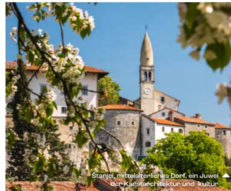
Stanjel, mittelalterliches Dorf, ein Juwel der Karstarchitektur und -kultur ▲

Von Ljubljana, der Hauptstadt Sloweniens, bis hin zu unglaublichen Wäldern und Waldreservaten – hier können Sie Orte bestaunen, die zum UNESCO-Welterbe gehören. In der touristischen Makroregion „Ljubljana und Zentralslowenien“ finden Sie die ideale Mischung aus urbanem Flair und ländlicher Ruhe.