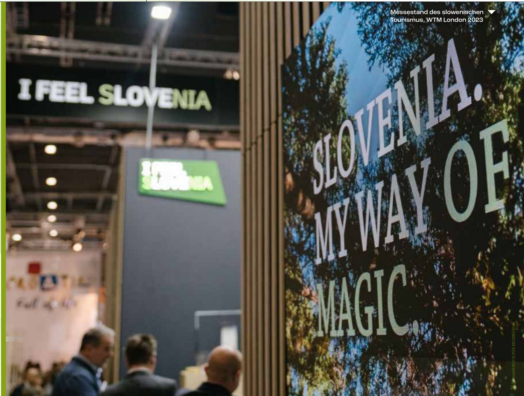
Messestand des slowenischen Tourismus, WTM London 2023