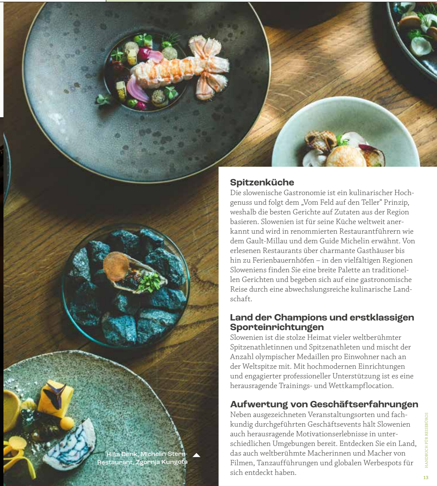
Hiša Denk, Michelin-Stern-Restaurant, Zgornja Kungota ▲