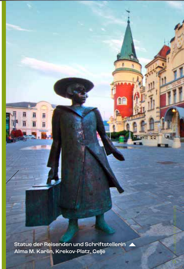
Statue der Reisenden und Schriftstellerin ▲ Alma M. Karlin, Krekov-Platz, Celje

In Slowenien knüpfen digitale Nomaden, die erfolgreich Beruf und Reisen kombinieren, an das Vermächtnis von Alma M. Karlin an, einer unerschrockenen Entdeckerin, die nach dem Ersten Weltkrieg mit nichts als einer Schreibmaschine bewaffnet um den Globus tingelte. Heute dient ihre bemerkenswerte Reise einer neuen Generation von Weltbürgerinnen und Weltbürgern als bleibende Inspiration.