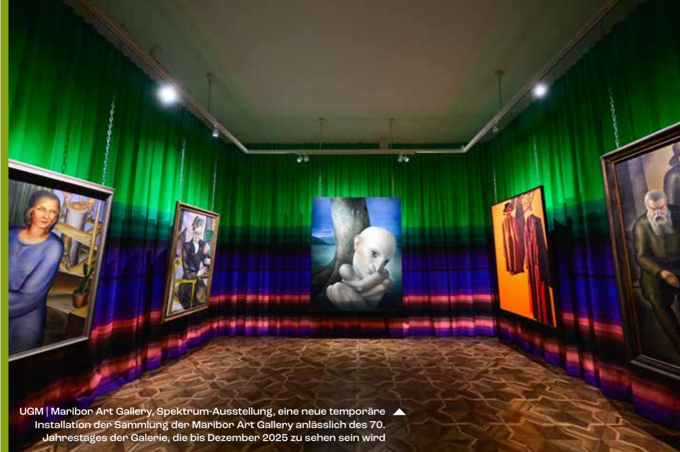
UGM | Maribor Art Gallery, Spektrum-Ausstellung, eine neue temporäre Installation der Sammlung der Maribor Art Gallery anlässlich des 70. Jahrestages der Galerie, die bis Dezember 2025 zu sehen sein wird ▲