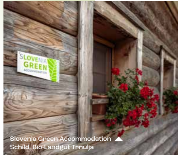
Slovenia Green Accommodation ▲ Schild, Bio-Landgut Trninja

Als eines der wasserreichsten Länder Europas, kann Slowenien mit Trinkwasser von herausragender Qualität aufwarten. Es ist als erster europäischer Staat, der das Recht auf Wasser in seine Verfassung aufgenommen hat, in die Geschichte eingegangen. Unter dem Slogan „Weniger Plastik, mehr Nachhaltigkeit“ wird im slowenischen Tourismus auf jede Art von Einwegplastik verzichtet.