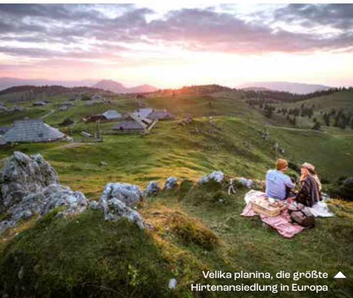
Velika planina, die größte Hirtenansiedlung in Europa ▲