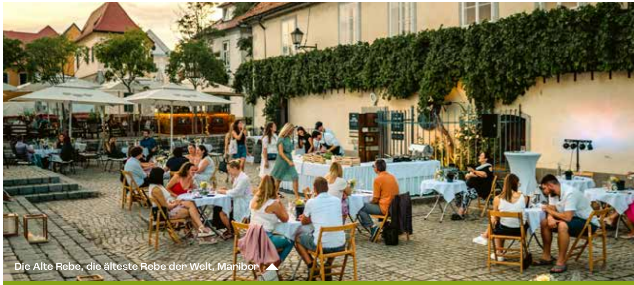
Die Alte Rebe, die älteste Rebe der Welt, Maribor ▲