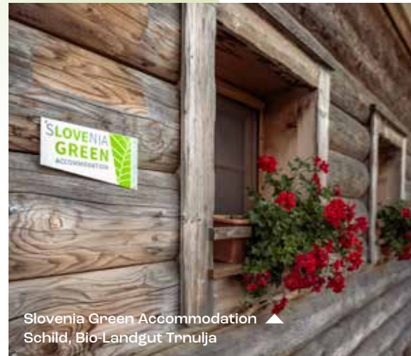
Slovenia Green Accommodation ▲ Schild, Bio-Landgut Trninja

Als eines der wasserreichsten Länder Europas, kann Slowenien mit Trinkwasser von herausragender Qualität aufwarten. Es ist als erster europäischer Staat, der das Recht auf Wasser in seine Verfassung aufgenommen hat, in die Geschichte eingegangen. Unter dem Slogan „Weniger Plastik, mehr Nachhaltigkeit“ wird im slowenischen Tourismus auf jede Art von Einwegplastik verzichtet.