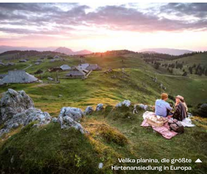
Velika planina, die größte Hirtenansiedlung in Europa ▲