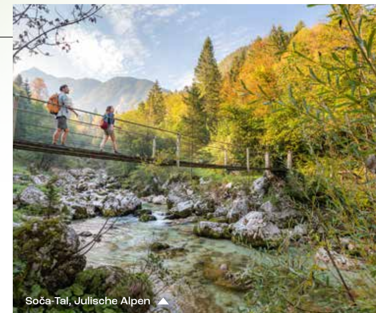
Soča-Tal, Julische Alpen ▲

Neben den natürlichen und kulturellen Besonderheiten der Alpen, die in einem der ältesten Nationalparks Europas geschützt sind, bietet die touristische Makroregion „Alpenländisches Slowenien“ eine unglaubliche Vielzahl an Möglichkeiten für Aktivitäten unter freiem Himmel. Hier bleiben Sie immer in Kontakt mit der Natur!