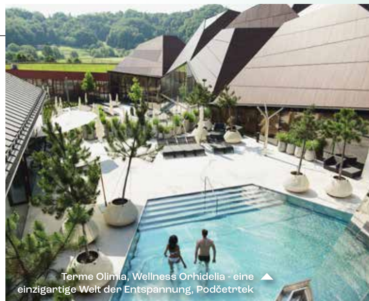
Terme Olimia, Wellness Orhidelia - eine einzigartige Welt der Entspannung, Podčetrtek ▲

Am Rande der Tiefebene, die Mitteleuropa seinen unverwechselbaren Charakter verleiht, finden Sie eine Reihe slowenischer Thermen und Heilbäder. Sie sind zwischen sanften Hügeln eingebettet, auf denen seit Jahrtausenden Wein angebaut wird. Die touristische Makroregion „Thermales Pannonisches Slowenien“ ist für seine authentische und herzliche Küche bekannt.