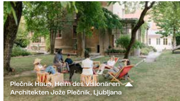
Plečnik Haus, Heim des visionären Architekten Jože Plečnik, Ljubljana ▲

Wenn Sie in Slowenien von einer Stadt zur anderen reisen, präsentiert sich Ihnen die Natur auf Schritt und Tritt in all ihrer Schönheit. Jeder Stopp bietet eine bezaubernde Mischung aus lokalem Charme und historischen Besonderheiten. Sloweniens Städte zeichnen sich durch ihre Einzigartigkeit aus, doch haben sie eines gemeinsam: Sie sind von überschaubarer Größe und somit leicht zu erkunden.