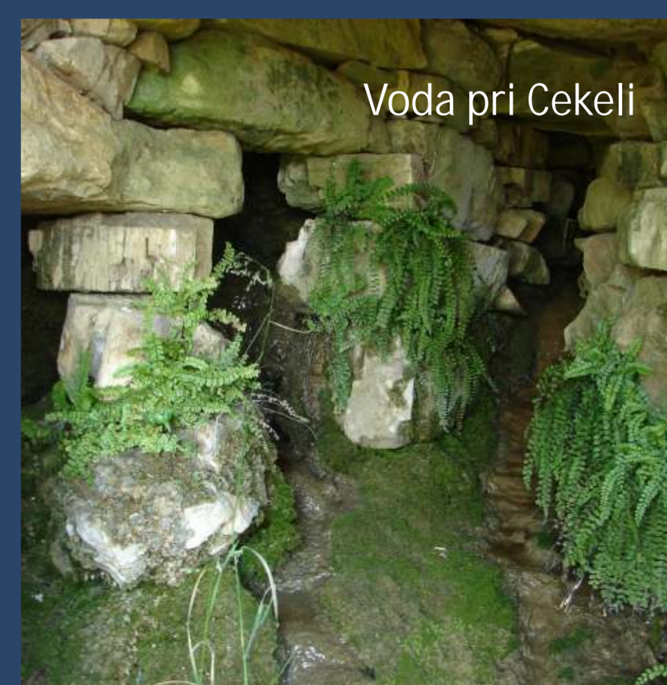
Voda pri Cekeli