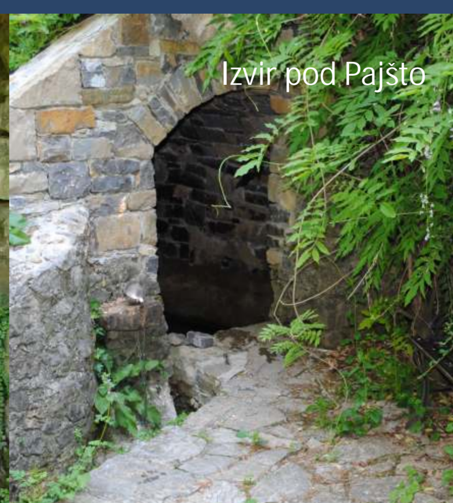
Izvir pod Pajšto