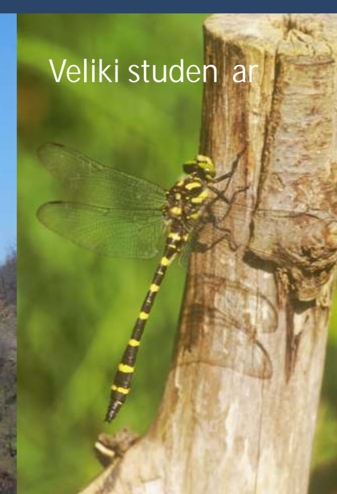
Veliki studen ar