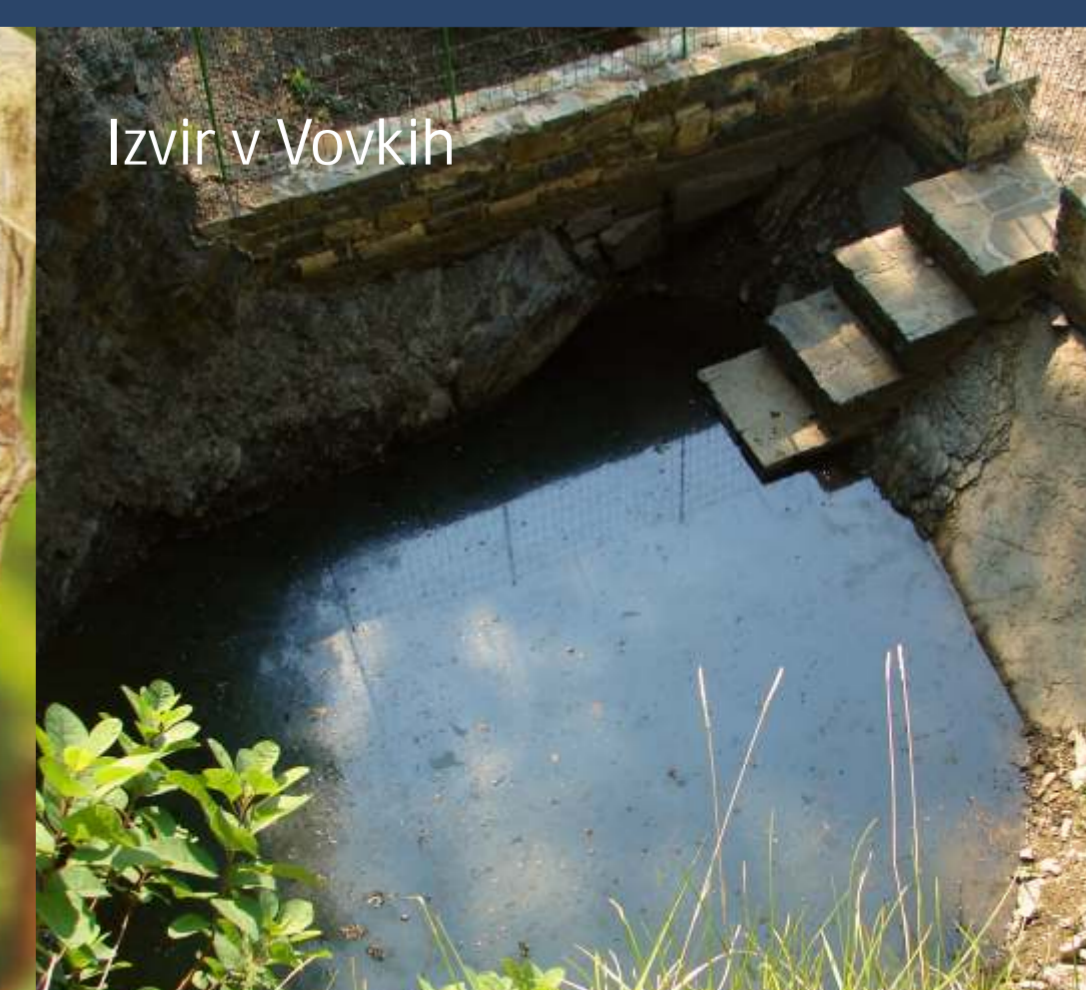
Izvir v Vovkih