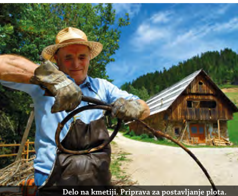
Delo na kmetiji. Priprava za postavljanje plota.

Spoštovanja vredne so tudi ohranjene tradicije, ki jih zasluliš ob zvoku citer na gorskih kmetijah, ob dotiku izdelkov iz filca, ustvarjenega iz volne avtohtonih jezersko-solčavskih ovc, ob starodavnih cerkvah in kapelah, ob oglarski in gozdarski bajti, ob vsakem pozdravu s trdoživimi domačini.