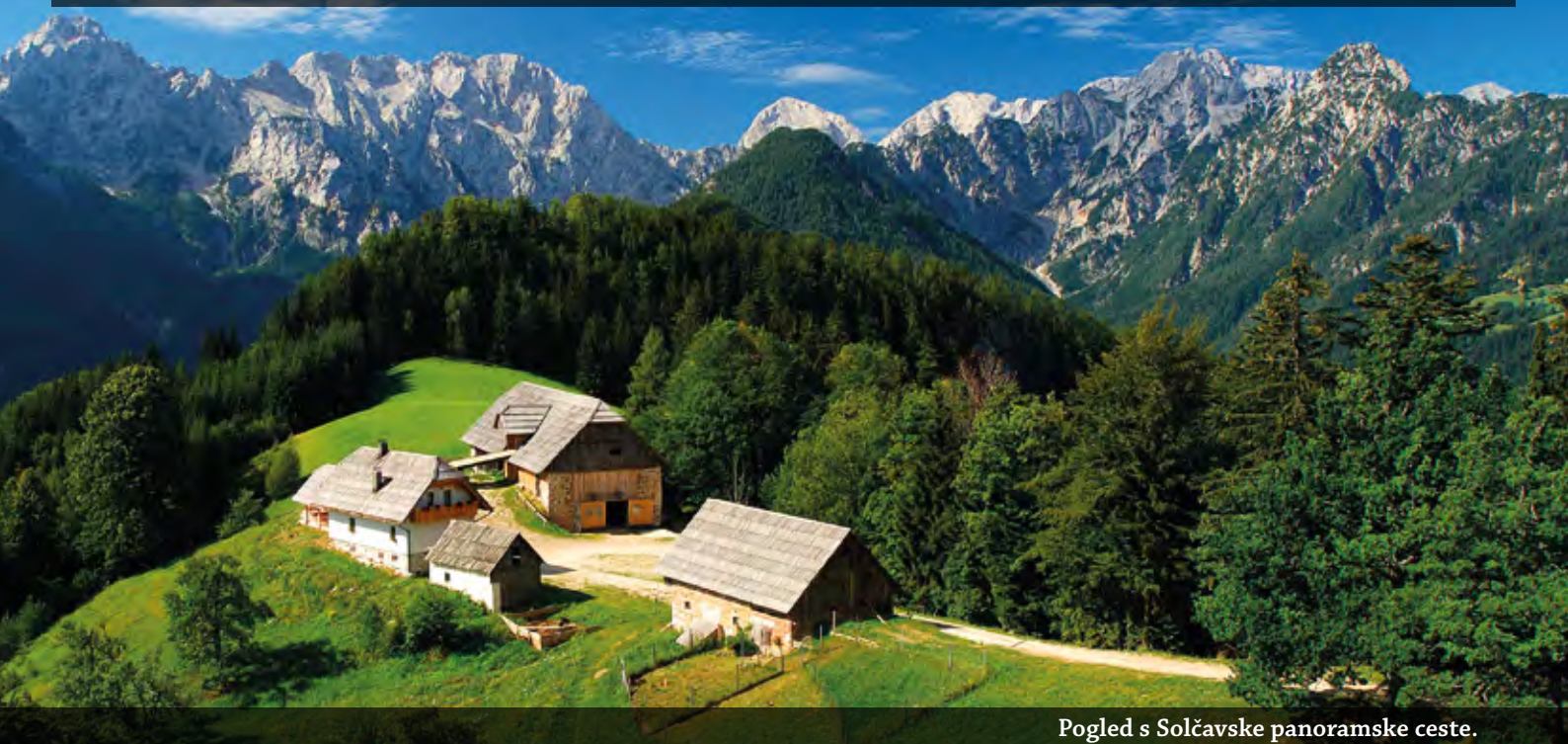
Pogled s Solčavske panoramske ceste.

Vrhovi slikovitih Alp, idiličnost treh alpskih ledeniških dolin, krajinski parki nešteti naravnih in kulturnih posebnosti, gostoljubje ljudi, razkošje njihovih tradicionalnih obrti in jedi: to so samo drobcici v veliki sliki sobivanja neokrnjene narave in človeške ustvarjalnosti. Solčavsko je harmonija treh dolin in hkrati sozvočje izjemne narave ter skrbno premišljenega turizma.