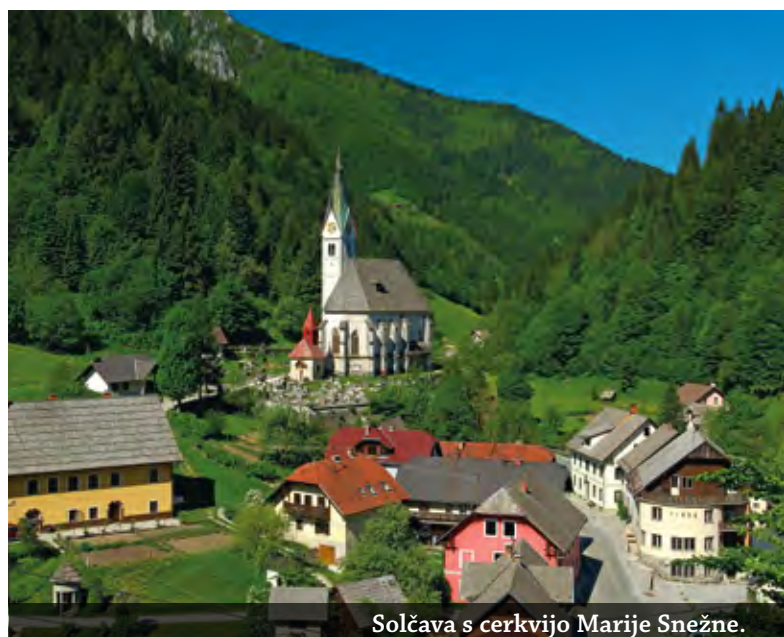
Solčava s cerkvijo Marije Snežne.